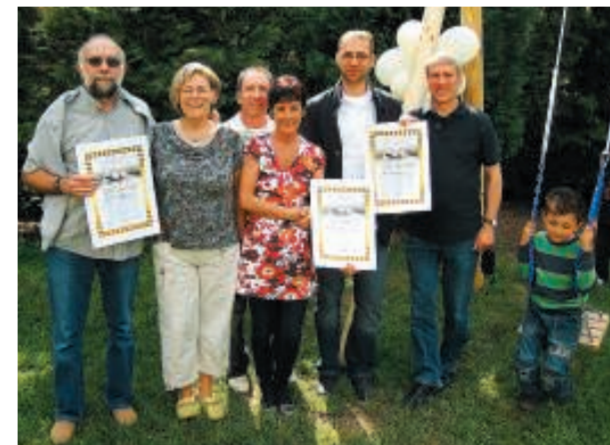
Helfer-Team: Die AG Kindergarten bei der Übergabe einer neuen Schaukel.