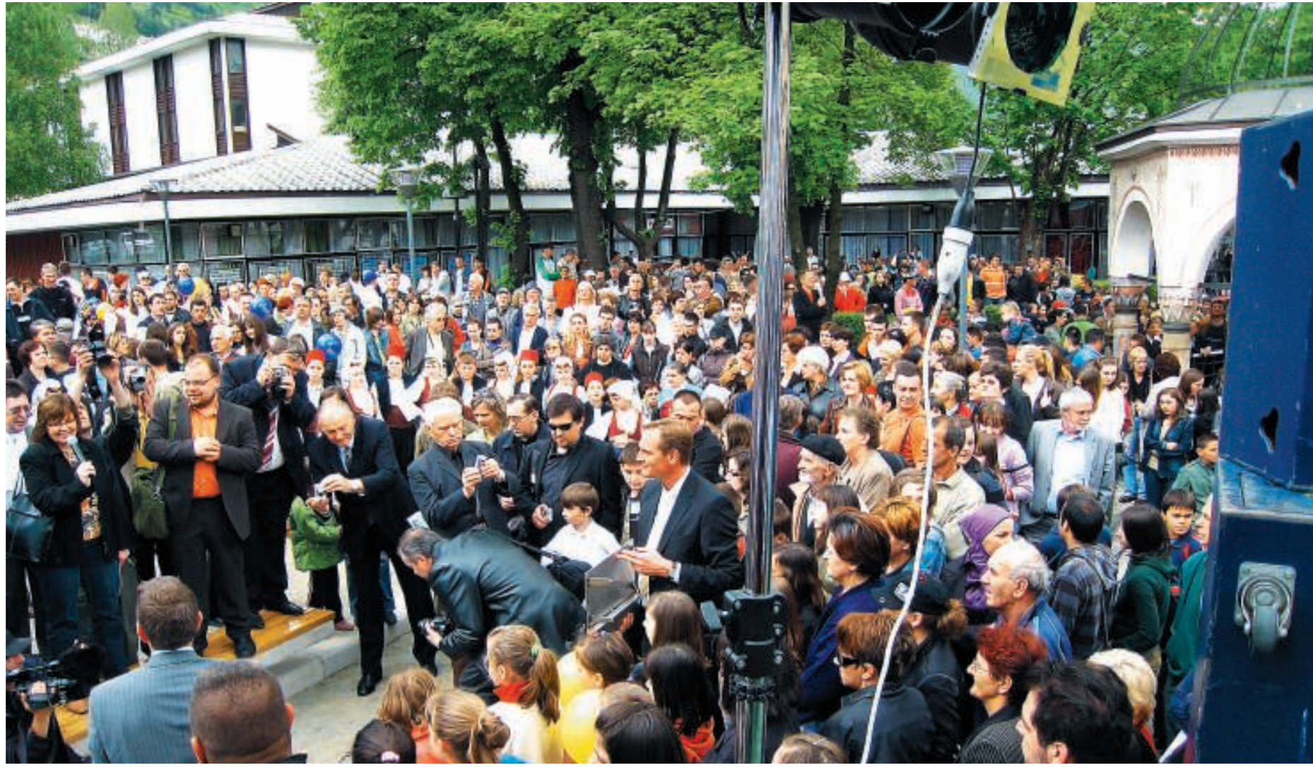
Eröffnungsfeier: Blick von der Open-Air-Bühne auf den Leipziger Platz, den Tausende von Travnikern in Besitz nehmen.